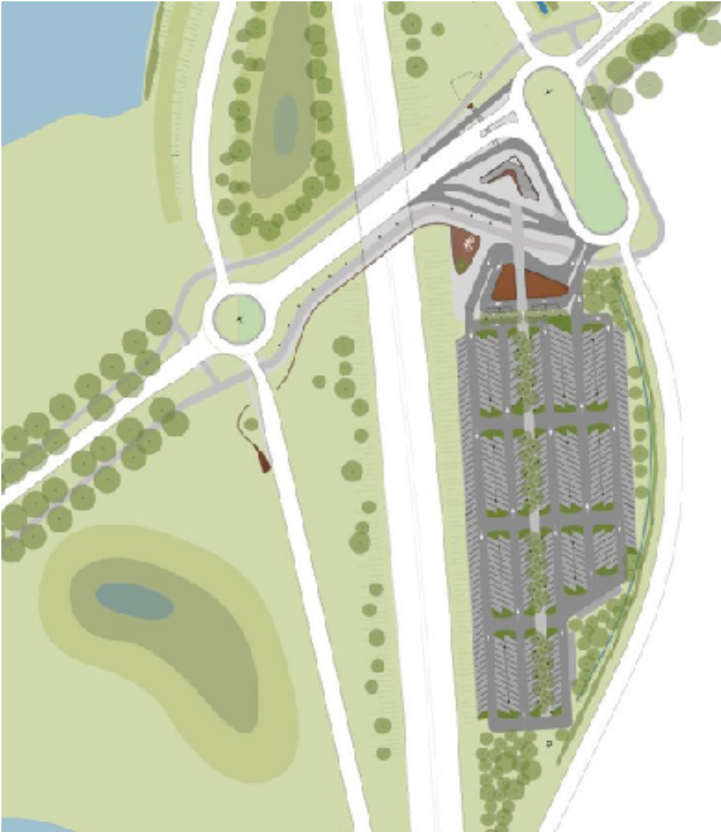
Uitsnede plankaart Transferium De Punt