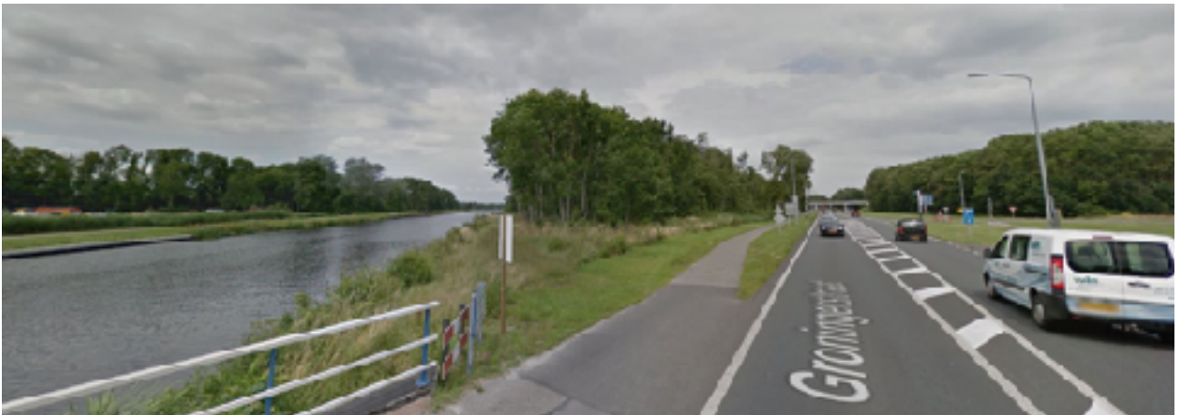
Zicht vanaf de Groningerstraat, van boven naar beneden het noordoostelijk, zuidoostelijk, zuidwestelijk en noordwestelijk deel van het plangebied